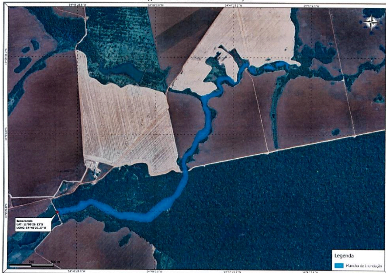
Figura 1 - Mancha de inundação